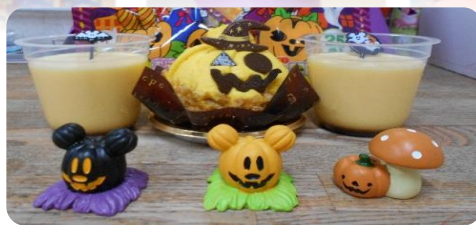
【ハロウィンパーティー】

ハロウィンのクイズとボーリングをしました。ハロウィンが約2000年前からあることを知りました。《byウー☆ちゃん》