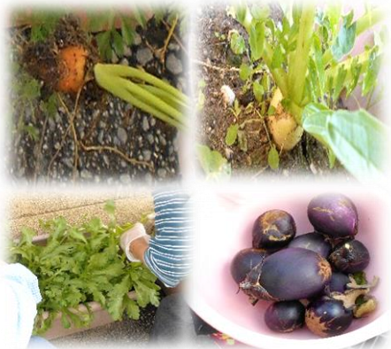
【きのこスープ／春菊、大根、ナスの収穫】