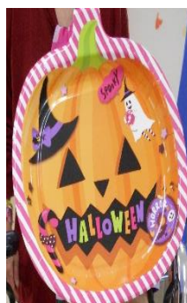
【憩う会…ハロウィンキャップ】