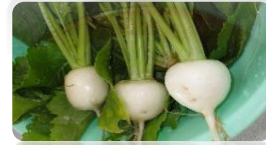
【ミルクカレースープ、苺・かぶ収穫】