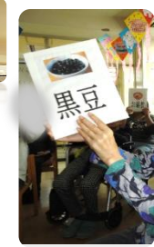
【獅子舞、福笑い、おせちゲーム】